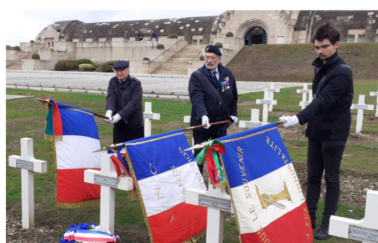
*Souvenir Français Paris 11°, 2023.