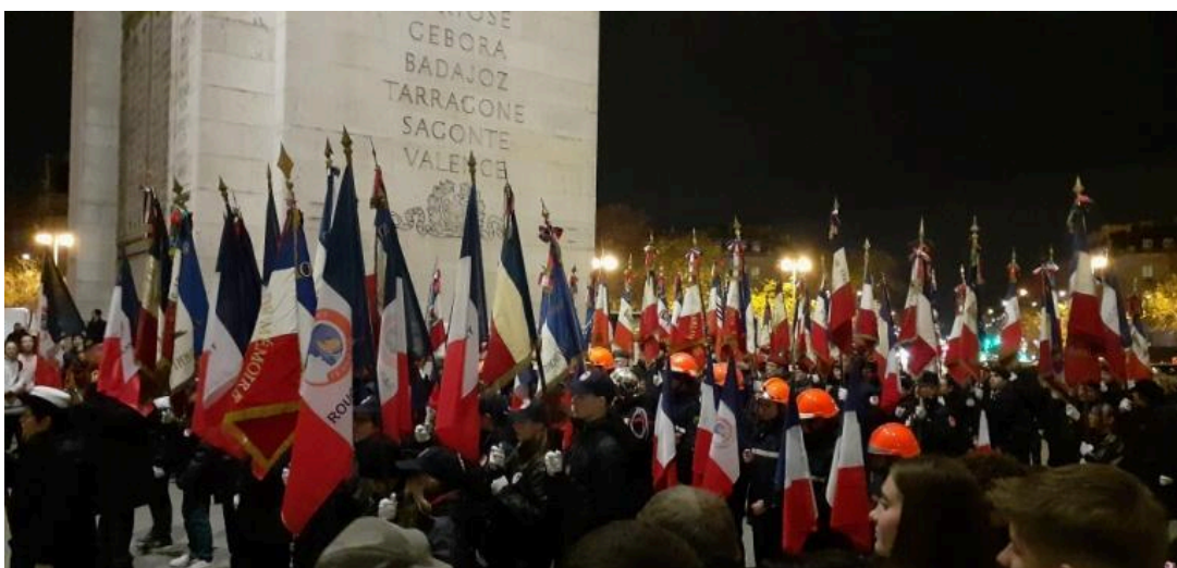
- 04 décembre : messe de l'UNC.