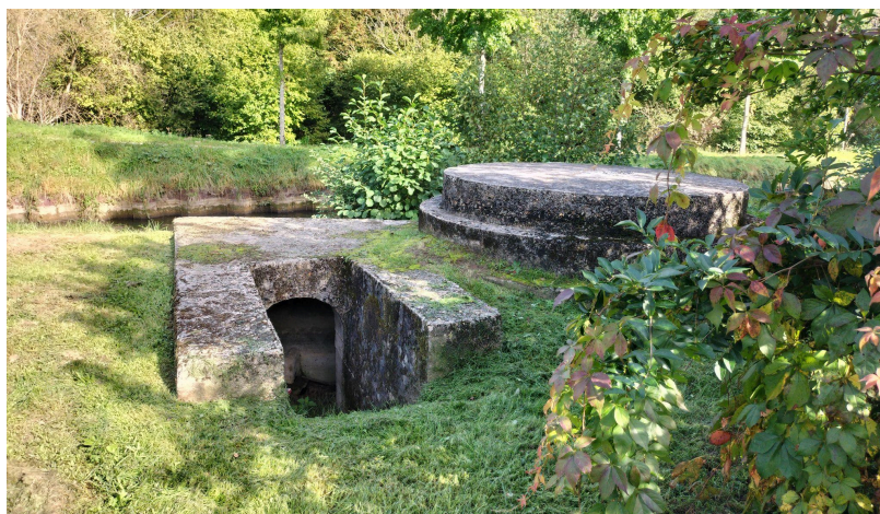
Casemate pour mitrailleuse Hotchkiss à Varinfroy, protégeant un pont sur l'Ourcq, état 2023.

Pendant les 9 mois de la Drôle de Guerre, les ouvriers militaires, souvent des anciens combattants de la Grande Guerre travaillant dans Paris et ses alentours, vont œuvrer à la construction de fossés anti-chars, casemates, systèmes d'inondations, postes d'observations etc... Les blockhaus pour canons anti-chars sont faiblement gardés et doivent en principe servir de point d'appui à des unités se repliant sur Paris et éviter la situation délicate de la Bataille de la Marne en 1914. Les moyens alloués à la Position de Défense sont faibles, on manque de main d'oeuvre, de canons et mitrailleuses.