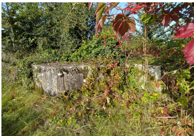
Cuve pour canon de 47mm de Marine utilisé en anti-char à Senlis, état 2023.

Après guerre, les fortifications de Paris sont entièrement laissées à l'abandon et l'urbanisation grignote petit à petit ce qui reste de la Ligne Chauvineau.